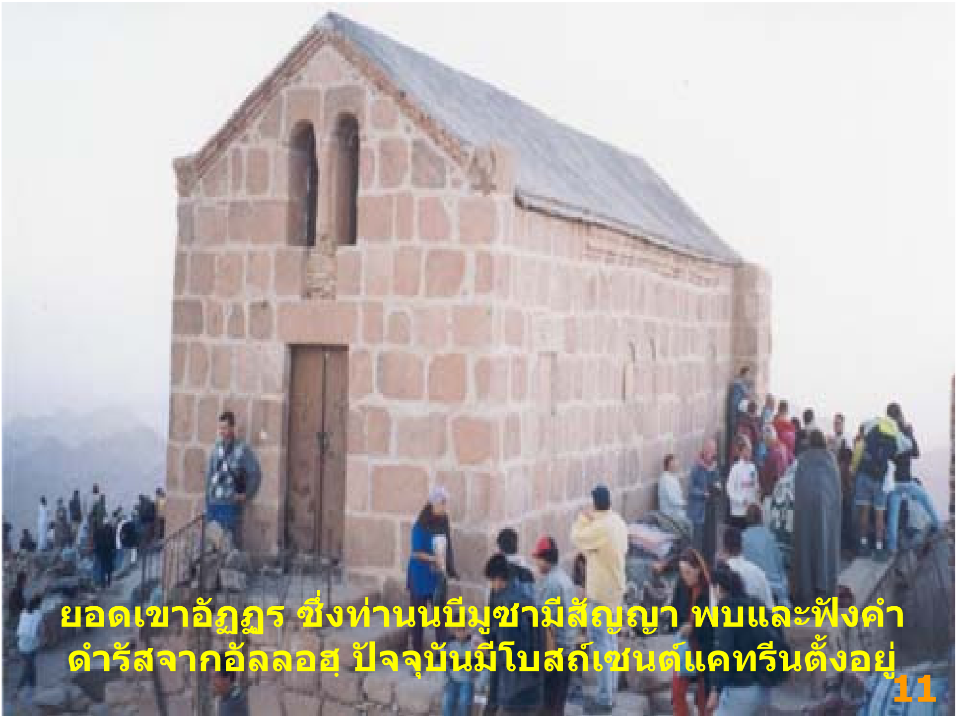
ยอดเขาอัญญา ซึ่งท่านนบีมุขามีสัญญา พบและฟังคำ ดำรัสจากอัลลอฮ์ ปัจจุบันมีโบสถ์เซนต์แคทรินตั้งอยู่